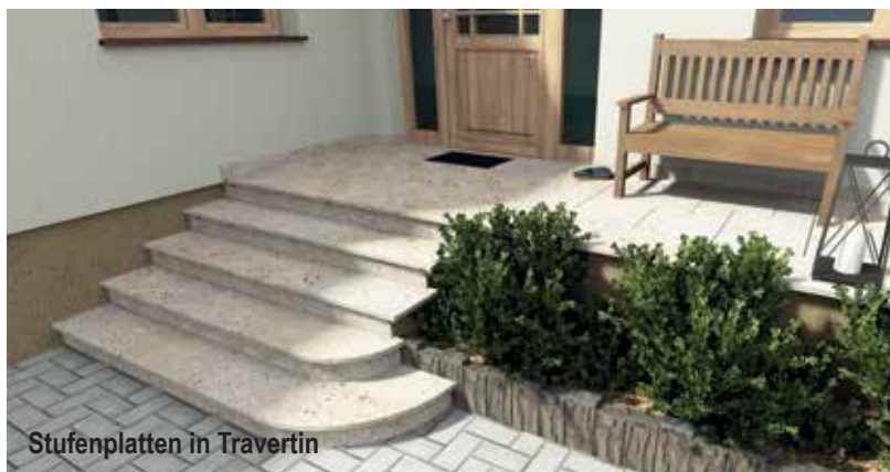
Stufenplatten in Travertin