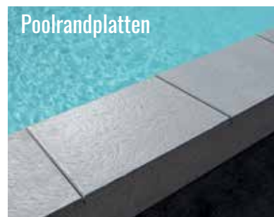
siehe Seite 102 und 108