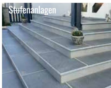
siehe Seite 86