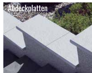
siehe Seite 160